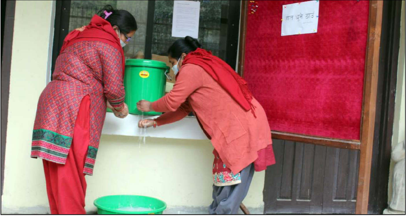
साबुन पानीले हात धोऔँ : कोरोना भाइरसबाट बच्न कीर्तिपुर नगरपालिकाको नयाँ भवन, अमलिसको मूलद्वारमा साबुन पानीले हात धुने व्यवस्था गर्दै। नगरपालिकाले प्रत्येक वडामा साबुन पानीले हात धुने व्यवस्था गरेको छ।