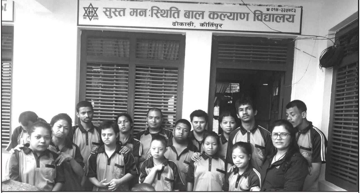
सुस्तमनस्थिति बालकल्याण विद्यालयमा अध्यनरत विद्यार्थीहरु र शिक्षक