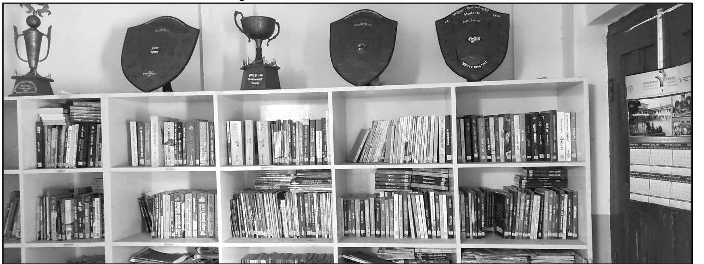
काव्य/बाल पुस्तकालय विश्वराष्ट्रिय माध्यमिक विद्यालय

नेपाल सरकारबाट बालबालिकाहरूका लागि सार्वजनिक बाल पुस्तकालय स्थापना गर्नको लागि काव्य तथा बाल पुस्तकालय शिर्षकमा रु ५ लाख प्राप्त भएको थियो । उक्त बाल पुस्तकालय स्थापना तथा सञ्चालन गर्नको लागि श्री विश्वराष्ट्रिय मा. वि.लाई रु ५ लाखको पुस्तक खरिद गरी व्यवस्थापन गर्ने जिम्मा दिइएको थियो । तलको तस्वीर काव्य/बाल पुस्तकालयको हो ।