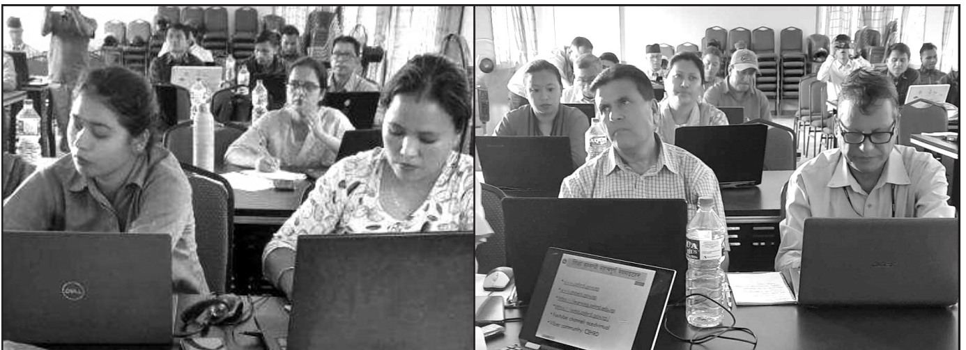
इमिस सम्बन्धी २ दिने कार्यशालाका सहभागी शिक्षक तथा विद्यालय कर्मचारीहरू

यस शीर्षक अन्तर्गत IEMIS सम्बन्धी २ दिने कार्यशाला, वार्षिक कार्यक्रमको स्थलगत अनुगमन, इमिस अध्यावधिकका लागि प्राविधिक सहायता, वार्षिक शैक्षिक स्थिति प्रतिवेदन छपाइ जस्ता कार्यहरू सञ्चालन गरिएको थियो ।