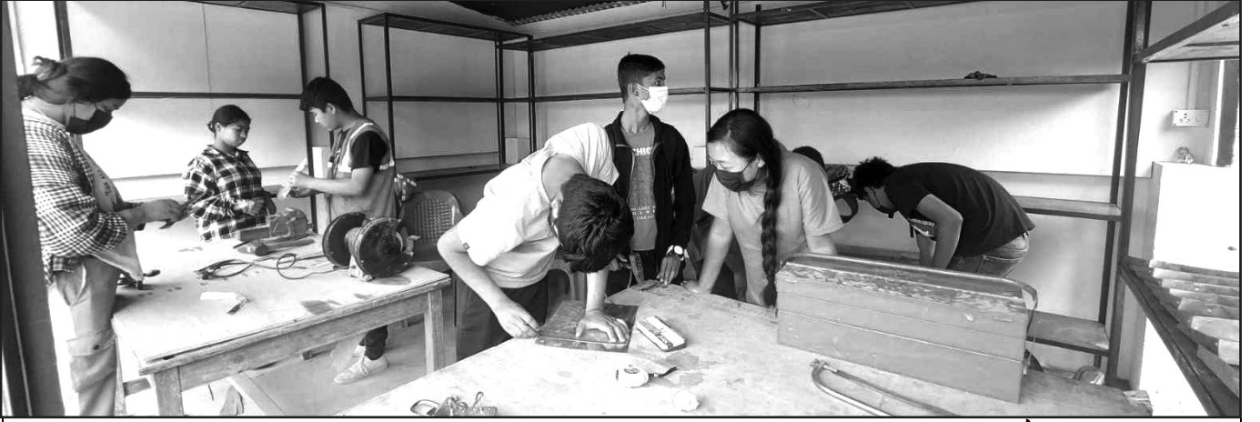
टेक्निकल धार तर्फका विद्यार्थीहरू मर्मत तथा नया सामग्री निर्माण गर्दै

यस शीर्षक अन्तर्गत रु ५ लाख २५ हजार प्राप्त भएको थियो । प्राविधिक धार चलेको विद्यालय प्राथमिकतामा रहने भएकाले जनसेवा माध्यमिक विद्यालयले यो शीर्षक अन्तर्गतको रकम प्राप्त गरेको थियो । उक्त विद्यालयले विद्यार्थीहरूको सहभागितामा इलेक्ट्रिकल/इलेक्ट्रोनिकस सम्बन्धीको उद्दम विद्यालयबाट नै सञ्चालन गरिरहेको छ । विद्यार्थीहरूले आफै सामग्री उत्पादन गरेका छन् । मर्मतका कार्यहरू अरुले भन्दा सस्तोमा उपलब्ध गराएका छन् । इलेक्ट्रिकलका कार्यहरू गर्न परेमा विद्यालयमा सम्पर्क गरेमा विद्यार्थीहरूले घरमा समेत गएर सेवा उपलब्ध गराउदै आएका छन् ।