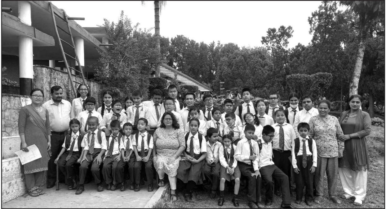
लेबोरेटरी माध्यमिक विद्यालयमा अध्यनरत दृष्टिविहिन बालबालिकाहरु र शिक्षक