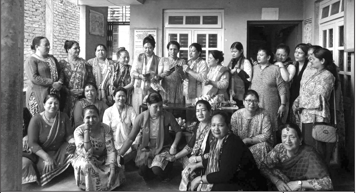
कीर्तिपुर गृहिणी महिला विद्यालयका विद्यार्थीहरुले गुरु पूर्णिमा मनाउँदै