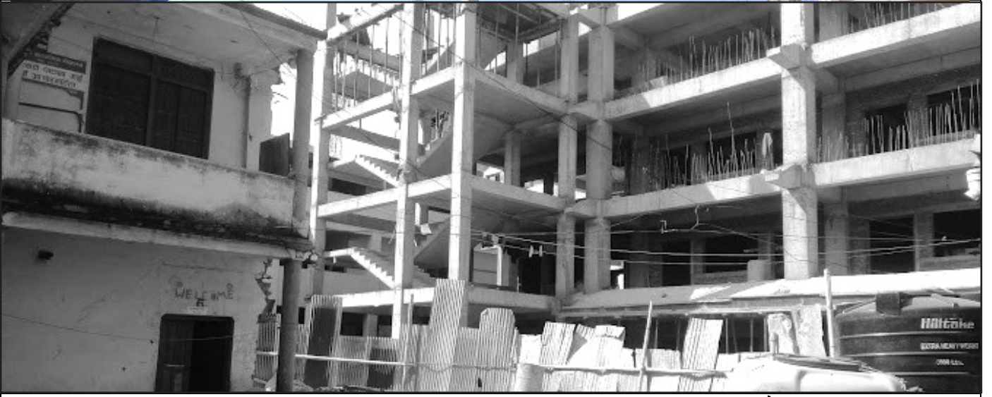
निर्माणाधिन कीर्तिपुर माध्यमिक विद्यालय: नगरको नमुना विद्यालयको रूपमा विकास हुँदै